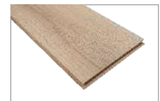
Trend Oak 1205 x 197 mm Caja 1.90 mt2 SKU 62300310