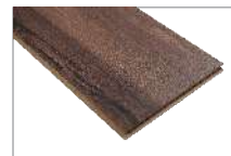
Thames Oak 1205 x 197 mm Caja 1.90 mt2 SKU 62300308