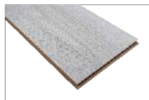
Ganges Oak 1205 x 197 mm Caja 1.90 mt2 SKU 62300312