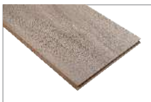
Danube Oak 1205 x 197 mm Caja 1.90 mt2 SKU 62300311

Renueva tus espacios con estilo y tranquilidad: nuestro piso laminado resistente al agua está diseñado para durar en cualquier espacio de tu casa. Las características principales y más destacables de los pisos laminados son su gran resistencia al tráfico, rápida instalación y fácil limpieza.