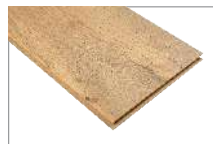
Erne Oak 1205 x 197 mm Caja 1.90 mt2 SKU 62300309