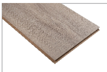
Danube Oak 1205 x 197 mm Caja 1.90 mt2 SKU 62300311

Renueva tus espacios con estilo y tranquilidad: nuestro piso laminado resistente al agua está diseñado para durar en cualquier espacio de tu casa. Las características principales y más destacables de los pisos laminados son su gran resistencia al tráfico, rápida instalación y fácil limpieza.