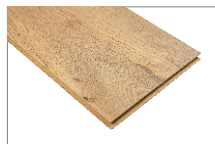
Ganges Oak 1205 x 197 mm Caja 1.90 mt2 SKU 62300312