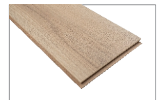
Trend Oak 1205 x 197 mm Caja 1.90 mt2 SKU 62300310