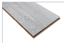
Erne Oak 1205 x 197 mm Caja 1.90 mt2 SKU 62300309