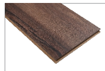
Thames Oak 1205 x 197 mm Caja 1.90 mt2 SKU 62300308