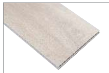
Albayalde JC 6187-2 1230 x 179 mm Caja 1.76 mt2