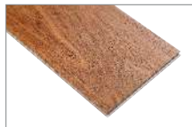
Red Oak XOM 13019 1230 x 179 mm Caja 1.76 mt2