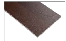
Merbau CDW-708L 1220 x 180 mm Caja 2.20 mt2