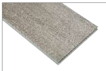
Gris Arena 6087-80A 1220 x 180 mm Caja 2.20 mt2

En Feltrex tenemos una gran variedad de formatos y colores para que puedas renovar tus espacios con un revestimiento de piso que permite instalarlos tanto en un espacio comercial como en el comedor, cocina o baño de tu casa.