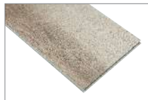
Arce LS 113-34 1230 x 179 mm Caja 1.76 mt2