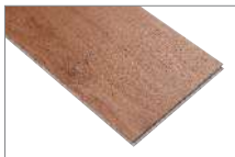
Cherry H17118 1230 x 179 mm Caja 1.76 mt2