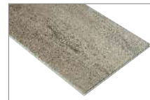
Roble Hacienda 1220 x 228 mm Caja 2.50 mt2