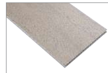
Ash 1220 x 180 mm Caja 2.20 mt2