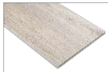
Light Oak 716 1220 x 228 mm Caja 2.23 mt2