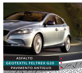
Prevención de Reflexión de Grietas