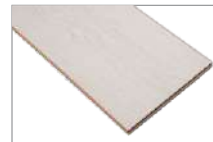
Saten Oak 1205 x 197 mm 2.37 mt2