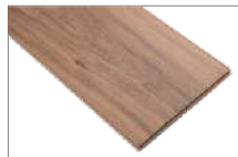
Astana Wnt 1205 x 197 mm 2.37 mt2