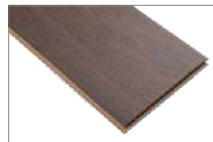
Kuba Oak 1205 x 197 mm 2.37 mt2