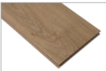
Sahara Oak 1205 x 197 mm 2.37 mt2

Si buscas un piso de aspecto noble que aporta calidez a tu espacio y además resistente, versátil y de fácil mantención, te invitamos a conocer nuestra colección de Artfloor. Las características principales y más destacables de los pisos laminados son su gran resistencia al tráfico, rápida instalación y fácil limpieza. En Feltrex encontrarás una amplia gama de pisos laminados en distintos formatos y colores.