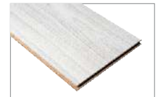
Gris 1290 x 193 mm 2.49 mt2