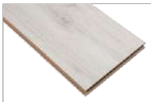
Barcelona 1205 x 197 mm 1.90 mt2

En Feltrex encontrarás una amplia gama de pisos laminados en distintos formatos y diseños.