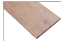
Paris 1205 x 197 mm 1.90 mt2