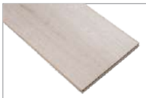
Viyana 1205 x 197 mm 1.90 mt2