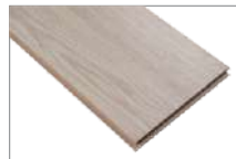
Madrid 1205 x 197 mm 1.90 mt2