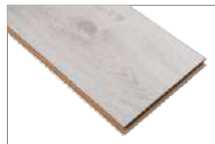
Cenevre 1205 x 197 mm 1.90 mt2