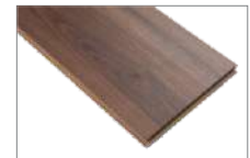
Saigon 1205 x 197 mm 1.90 mt2