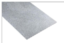
Gris acero 610 x 305 mm Caja 1.88 mt2 SKU: 62300074