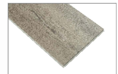
Roble hacienda 1220 x 182 mm Caja 2.22 mt2 SKU: 62300283