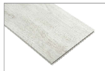
Roble blanco T/ ancha 1220 x 228 mm Caja 1.68 mt2 SKU: 62300241