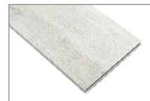
Roble blanco T/angosta 1230 x 179 mm Caja 1.76 mt2 SKU: 62300258