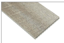
Gris 1230 x 179 mm Caja 1.76 mt2 SKU: 62300266

En Feltrex tenemos una gran variedad de formatos y colores para que puedas renovar tus espacios con un revestimiento de piso que permite instalarlos tanto en un espacio comercial como en el comedor, cocina o baño de tu casa.