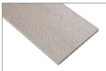
Ash 1220 x 180 mm Caja 2.22 mt2 SKU: 62300065