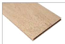
Muson 1205 x 197 mm 2.85 mt2