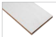
Lodos 1205 x 197 mm 2.85 mt2