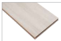
Samyeli 1205 x 197 mm 2.85 mt2

Si buscas un piso de aspecto noble que aporta calidez a tu espacio y además resistente, versátil y de fácil mantención, te invitamos a conocer nuestra colección de Artfloor. Las características principales y más destacables de los pisos laminados son su gran resistencia al tráfico, rápida instalación y fácil limpieza. En Feltrex encontrarás una amplia gama de pisos laminados en distintos formatos y diseños.